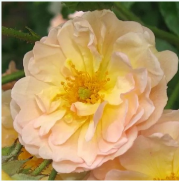
Ghislaine de Féligonde

purpur-rosa - historisch, alte gartenrose 350-550 cm sehr schwach, kaum wahrnehmbar duftende rose - duftbeschreibung nicht verfügbar Rudolf Geschwind