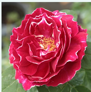
Baron Girod de l'Ain

rosa - historische, alte gartenrose 280-420 cm stark, lang anhaltend duftende rose - klassischer altrosenduft Rudolf Geschwind