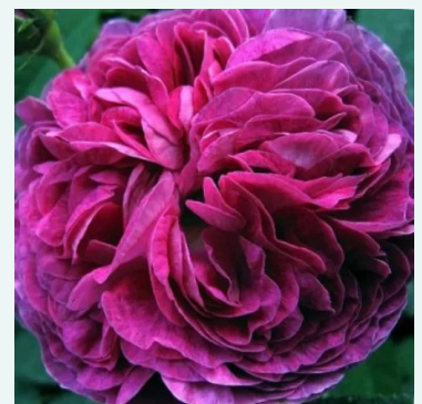
Belle de Crécy

rot - historische, remontierende hybridrose 100-150 cm sehr intensiv, den garten erfüllende rose - reich, altrosenartig Reverchon